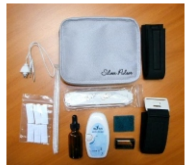
Silver Pulser Experimentier Set