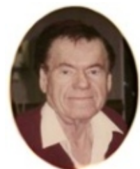
Dr. Robert Beck

Auch wenn der elektrische Fluss die Viren vielleicht nicht gänzlich abtötet, so hat die Forschung doch gezeigt, dass sie für einige Zeit die Fähigkeit verlieren, andere Zellen zu infizieren. Bakterien, Pilze und Parasiten im Blut werden nach Dr. Beck ebenfalls durch den elektrischen Fluss zerstört oder neutralisiert. Die Erreger, die nicht in die körpereigenen Zellen eindringen können, werden durch das Immunsystem problemlos abtransportiert.